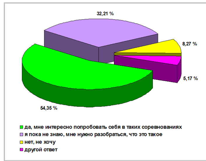
Рис. 2. Отношение «здоровых» школьников к ситуации участия в физкультурно-массовых мероприятиях совместно со школьниками-инвалидами

Вопрос о том, что такое Паралимпийские игры не вызвал затруднений у школьников – 88,3% ответили правильно.